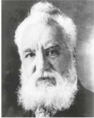
Alexander Graham Bell